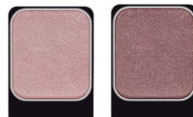
4440.XX EYE SHADOW #88, 186