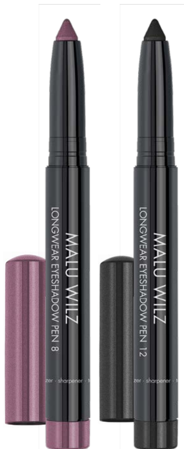
LONGWEAR EYESHADOW PEN # 8, 12