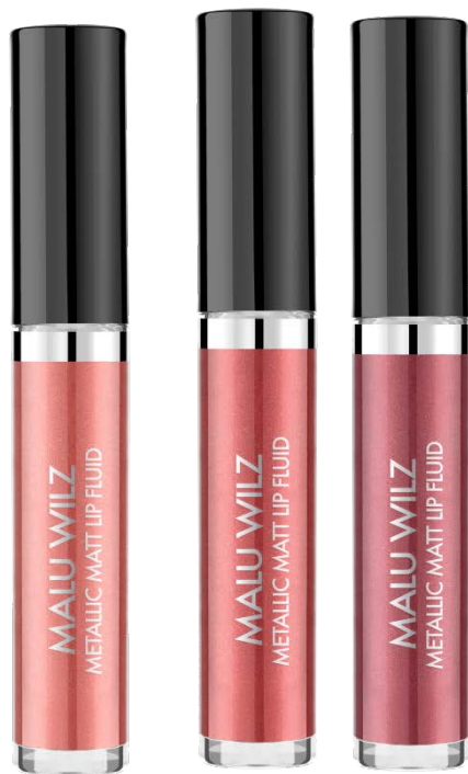
METALLIC MATT LIP COLOR # 02, 04, 07