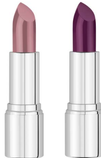
LIPSTICK # 48, 98